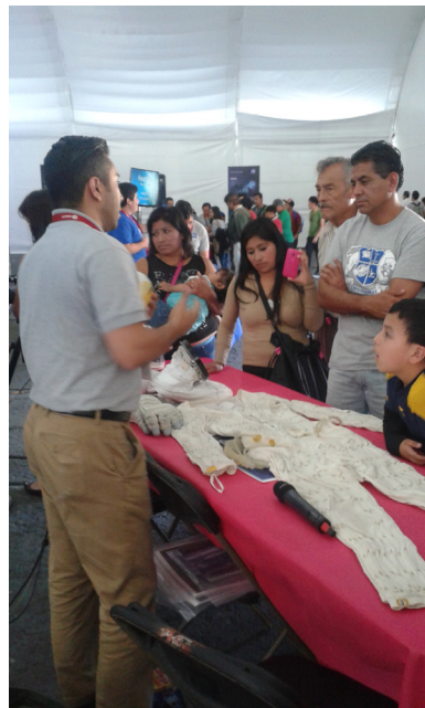
Fig. 3. Exposición de la NASA sobre la composición de un traje espacial.