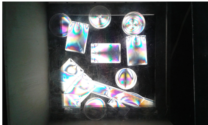
Fig. 1. Fenómenos de la luz. Exposición del Centro de Investigación en Óptica.

Entre lo más destacado podemos decir que estuvieron las exhibiciones de siete museos, los cuales explicaban el funcionamiento de la luz desde diversas perspectivas. Por ejemplo, mientras Papalote Museo del Niño hablaba sobre cómo se hizo y cómo se podía ver en forma de energía —usando como ejemplo la bobina de Tesla—, el Museo Interactivo de Economía enseñaba a las personas sobre el gasto económico que genera el uso de electricidad en los hogares del Distrito Federal con su exposición “Luz, más luz”. Por su parte, el Museo de Tezozomoc, del Instituto Politécnico Nacional, mostró algunos fenómenos de refracción, difracción, ondas de televisión, fluorescencia, leds, etcétera, con llamativas instalaciones en la muestra titulada “Por una Luz común”.