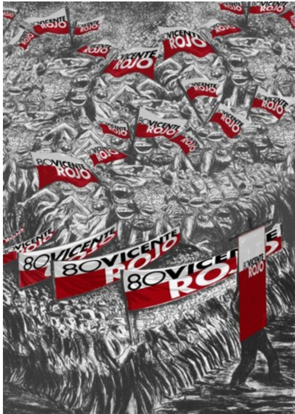
Ilustración: 80 Vicente Rojo, cartel por Fernando González Cortázar. CCUT - UNAM

En esta gestualidad ¿cómo saber cuál era el buen diseño?