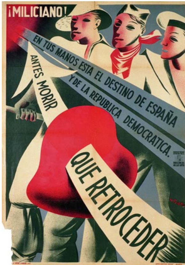
Ilustración: 'Miliciano: antes morir que retroceder', Miguel Prieto. 1936 Cromolitografía, 100 x 70 cm Universidad de Valencia (UV002148)

LCV: ¿Habías tomado clases de dibujo antes?