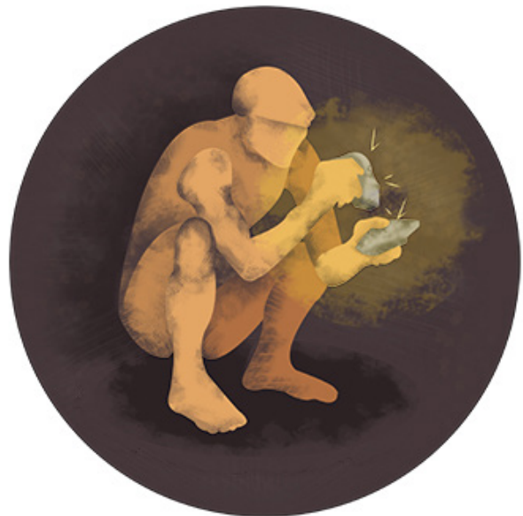
Figura 1. Antepasado del hombre produciendo fuego con piedras.

La cocina es la principal característica que nos distingue del resto de los mamíferos. Al menos eso es lo que plantea el Antropólogo Richard Wrangham, profesor en Antropología Biológica de la Universidad de Harvard, en su libro Catching Fire . En esencia, Wrangham plantea que varias características peculiares que sufrieron los primates, tales como el aumento en las dimensiones del cerebro y la disminución en el tamaño de los intestinos, hasta llegar a Homo sapiens , se debieron a las mejoras que la cocción introdujo en su alimentación. En efecto, aplicar el fuego a la cocina, hecho que Wrangham estima ocurrió hace