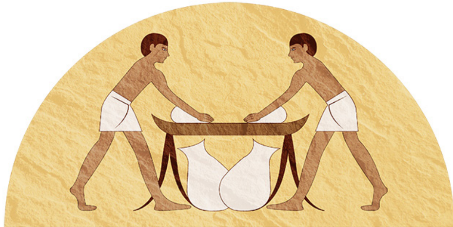
Figura 2. Egipcios amasando harina de trigo, alimento indispensable en la nutrición del hombre.

Una larga lista de sustancias se agregaría poco a poco a los ácidos cítrico y glutámico, dentro de los ingredientes básicos para la alimentación, elaborados mediante procesos industriales. Esta lista incluye hoy vitaminas, aminoácidos, gomas (como las xantanas empleadas como espesantes), el ácido láctico, edulcorantes no calóricos, como el aspartame, enzimas para una enorme diversidad de aplicaciones como el procesamiento de lácteos, la elaboración de leches deslactosadas, el procesamiento y extracción de jugos de frutas y, muy particularmente, enzimas para el procesamiento de almidón, que permitió primero el desarrollo de mieles de glucosa y, posteriormente, a inicios de los sesenta, de los mal llamados "jarabes fructosados".