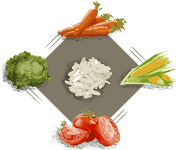
Figura 4. Vegetales comunes en la alimentación humana y arroz blanco.

Esta tecnología ya no es novedosa, aunque por la forma en la que frecuentemente se aborda en los medios, pareciera que sí. Rara vez en el debate sobre OGM se hace referencia al hecho de que hasta la última vez que se contaron y clasificaron los estudios científicos, en 2007, había ya cerca de 32,000 trabajos publicados relacionados con la seguridad de las plantas GM. Estas investigaciones sobre seguridad empezaron a aparecer en la literatura científica incluso antes de 1996, fecha en la que se inició su producción comercial. Así, cuando