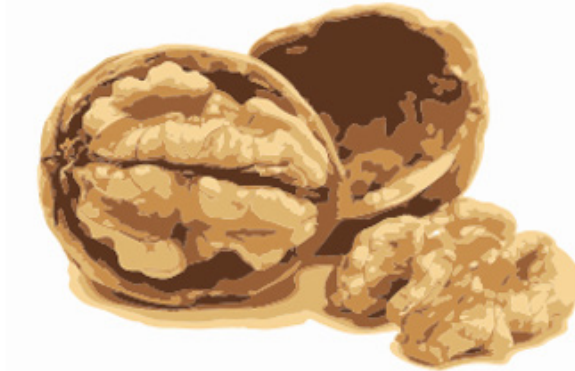
Figura 5. Las nueces contienen proteínas como la albúmina

muchísimas cajas de cereal éste se mezcla con la nuez. Sin embargo, el estado actual de la tecnología permite, por el contrario, eliminar esa proteína de la nuez y elaborar una nuez GM hipoalergénica que pueda comer cualquier persona.