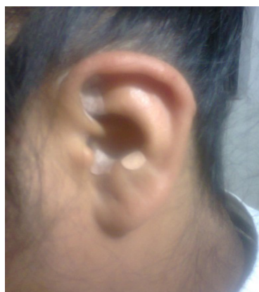
Figura 2. En la presente fotografía se muestra que se puede utilizar balín (color carne de forma redonda) y tachuela (color blanco de forma cuadrada) de manera conjunta. Se observa el enrojecimiento como señal de que empezó a actuar la auriculoterapia.

Las semillas o el material empleado se pueden quedar en la oreja por un tiempo promedio de ocho días. Pasado este lapso es posible que se quite el material y, si fuera necesario, se vuelven a colocar los puntos elegidos en la oreja contraria a la que se inició el tratamiento. No hay un límite temporal, pues el