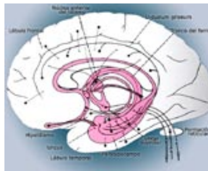
Figura 2. Esquema del sistema límbico.